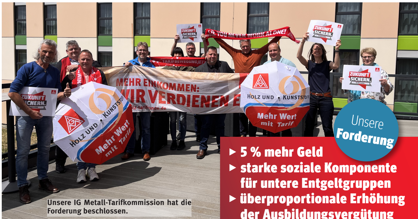
Unsere IG Metall-Tarifkommission hat die Forderung beschlossen.