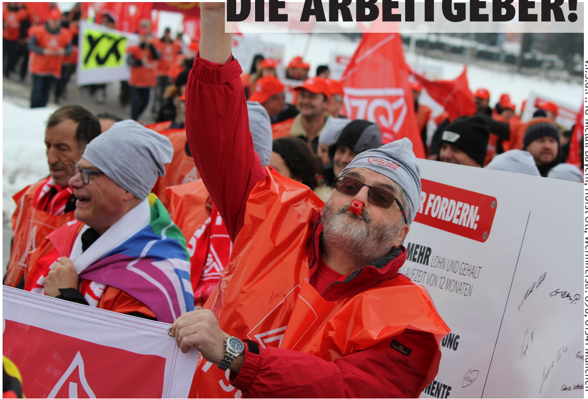
Vi. S. D. P.: IG Metall Bayern, Horst Ott, Werinherstr. 89b, 81541 München

Gute Tarifiergebnisse erzielen wir nicht in erster Linie am Verhandlungstisch. Entscheidend ist vielmehr, dass aus einer Tarifrunde eine echte Tarifbewegung wird. Heißt: Je mehr Beschäftigte für unsere Forderungen Flagge zeigen, desto besser wird unsere Verhandlungsposition. Also: Macht Euch bereit, beteiligt Euch an Aktionen und später wenn nötig an Warnstreiks! Kämpft gemeinsam für ein gutes Tarifiergebnis!